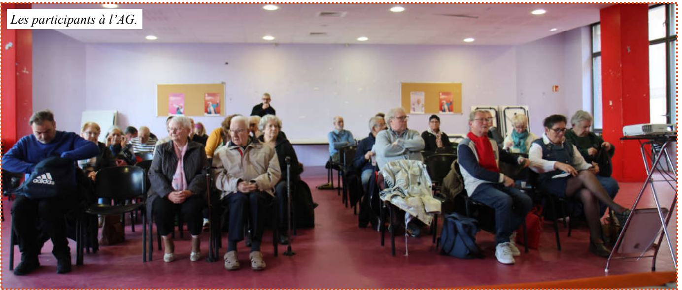
Les participants à l'AG.

L'assemblée générale s'est tenue le 26 mars en présence d'une cinquantaine d'adhérents. La matinée a été consacrée au rapport d'activité, au rapport financier et l'élection du conseil. L'après-midi, s'est tenue une animation-débat sur les médias.