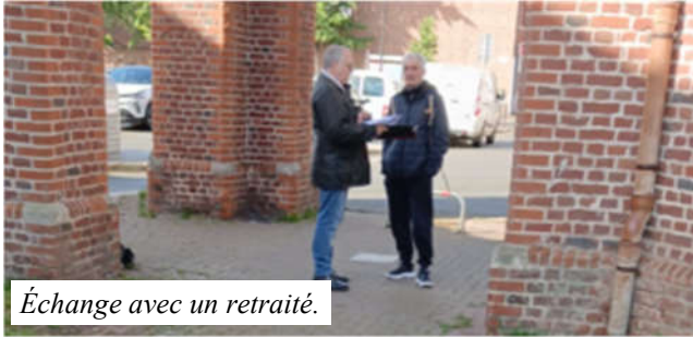
Échange avec un retraité.

Dans L'infolettre n°5 vous avez pu lire l'importance de remplir et de faire remplir cette enquête par les retraités aux pensions modestes, prioritairement, mais aussi aux autres retraités. D'autres actions sont prévues avant la fin du mois de juin 2026.