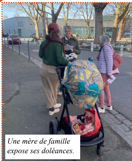
Une mère de famille expose ses doléances.

Pour cela, nous vous remercions de vous inscrire en écrivant à cfdt.retraites.lille@mailo.fr