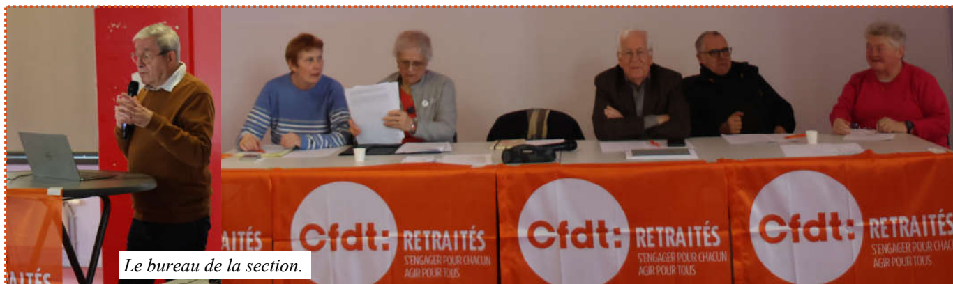
Le bureau de la section.