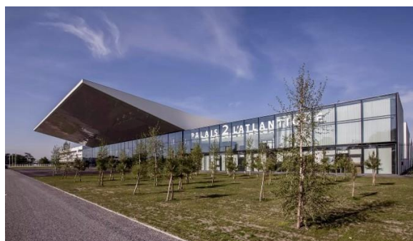
Le Palais 2 Atlantique, où se tiendra le congrès de Bordeaux.

Il est ici utile de rappeler que la CFDT c'est une union d'environ 1100 syndicats. Le congrès qui se tient en juin rassemblera des délégués de ces 1100 syndicats 1 , et ce sont eux qui peuvent déposer des amendements, voter sur les textes et élire le Bureau National ainsi que les membres d'autres instances. Plusieurs sections de notre syndicat se sont réunies 2 , en invitant leurs adhérents, afin de proposer des amendements et notre conseil, réuni le 4 mars, en a retenu 23 sur les 38 proposés après avoir éventuellement fait des modifications 1 . Trois exemples de propositions d'amendement :