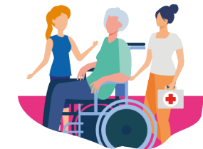
SPASAD SERVICE POLYVALENT AIDE ET SOINS