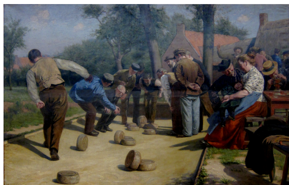
LA BOURLE EN FLANDRE Remi Googhe Musée La Piscine

La bourle est un jeu de boules traditionnel du nord de la France et de la Belgique. Inventée il y a plusieurs centaines d'années, des passionnés continuent à faire vivre cette activité sportive dans l'esprit de la fête flamande. Les bourloires de Saint Christophe et de Notre dame de la Consolation à Tourcoing sont classés monuments historiques et l'activité est inscrite à l'inventaire du patrimoine culturel et immatériel.