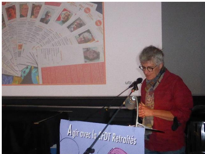
Retour sur la commission info/com et les journaux.