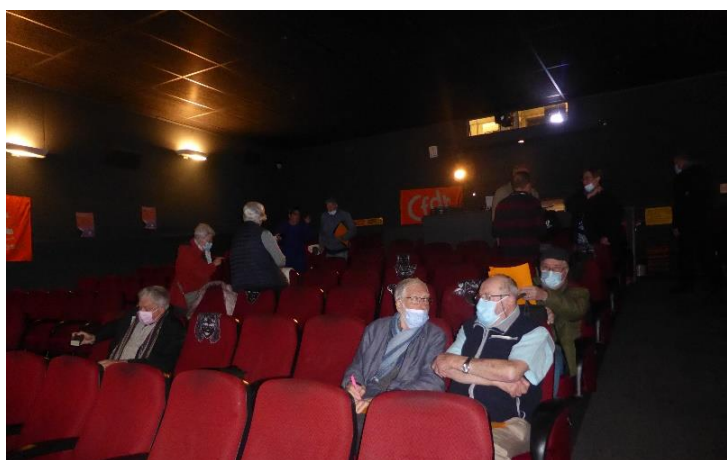
La salle se remplit.