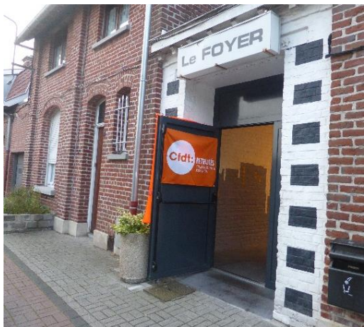
Le cinéma LE FOYER, lieu du congrès