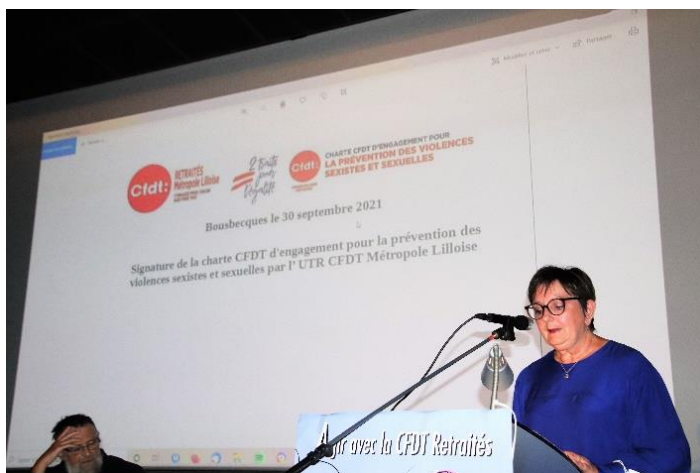
Présentation de la charte sur les VSS.