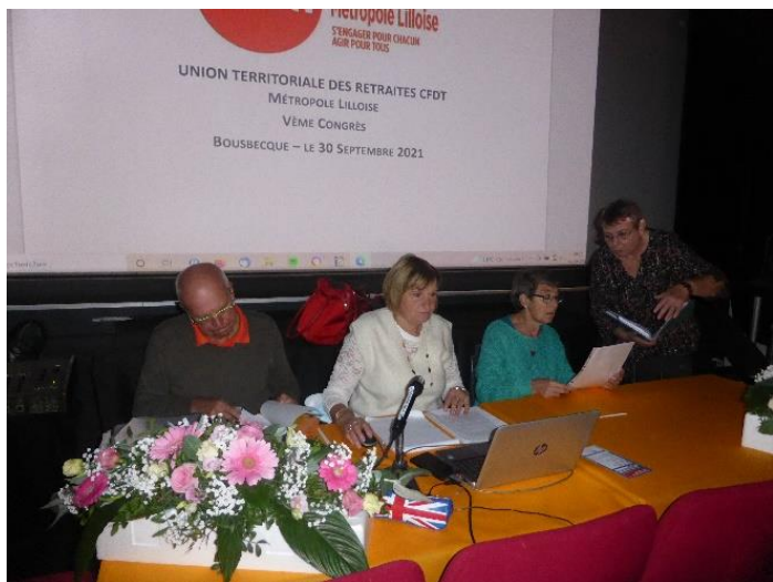
Le bureau du matin.