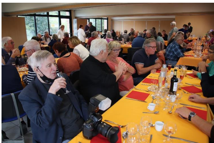
Le moment convivial du repas