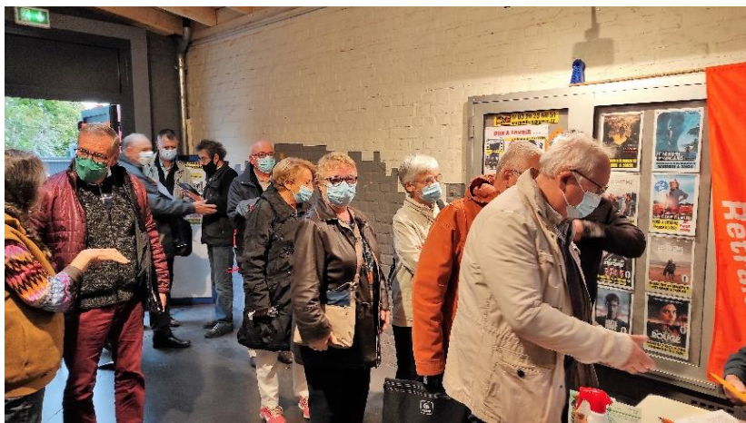
Accueil avec contrôle du pass sanitaire.