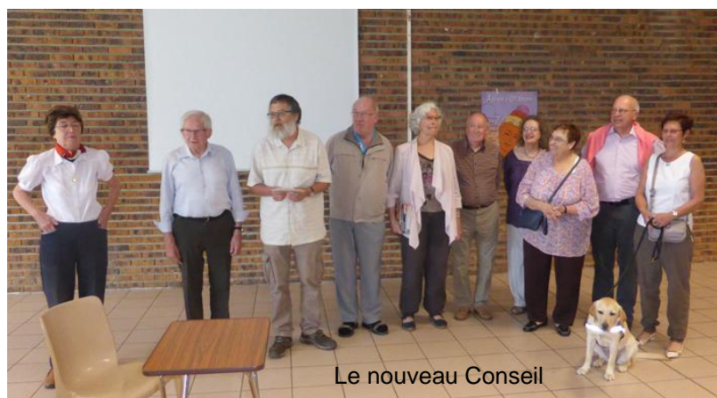
Le nouveau Conseil