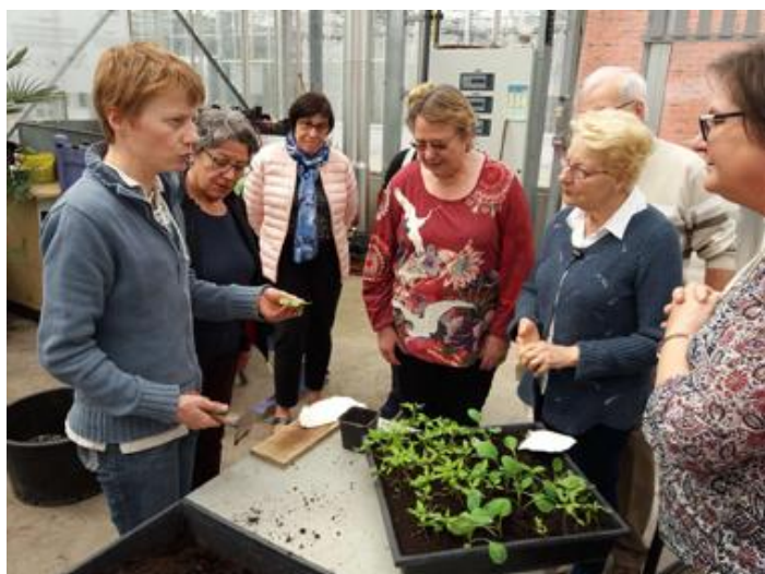
Bouturage au jardin botanique de Tourcoing

Le programme 2018 est déjà bouclé et nous préparons celui de 2019.