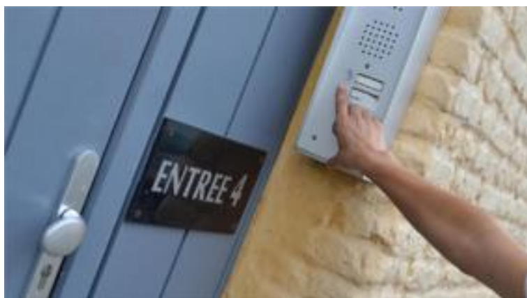
07/12/2017