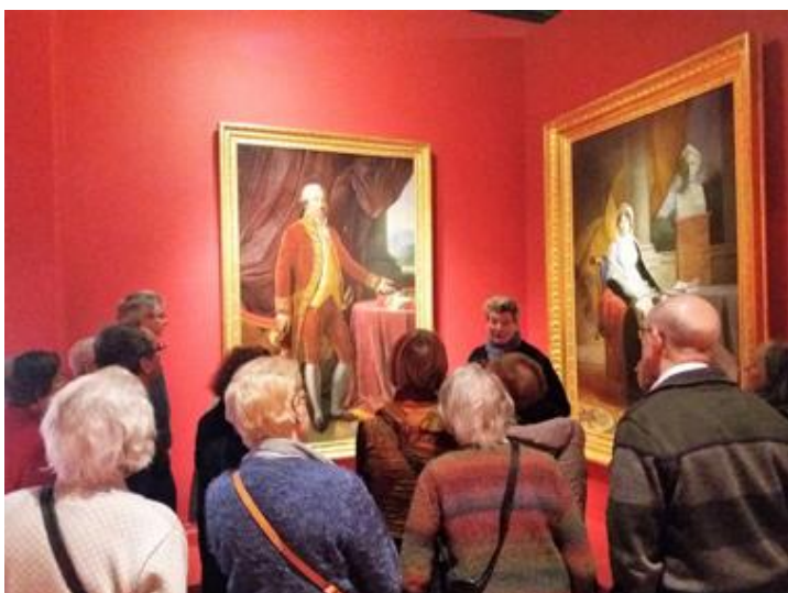
Exposition Napoléon à Arras