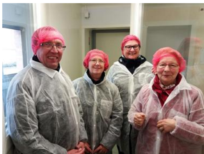
Atelier de fabrication des glaces Van den Castele