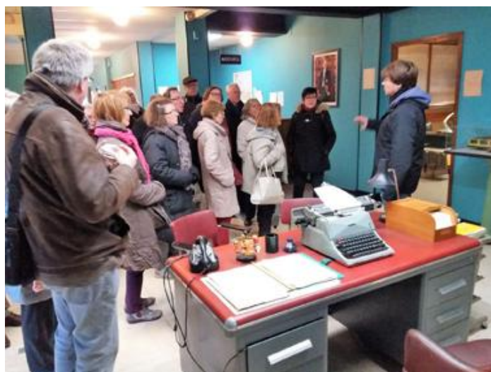
Studios des « Petits Meurtres d'Agatha Christie »