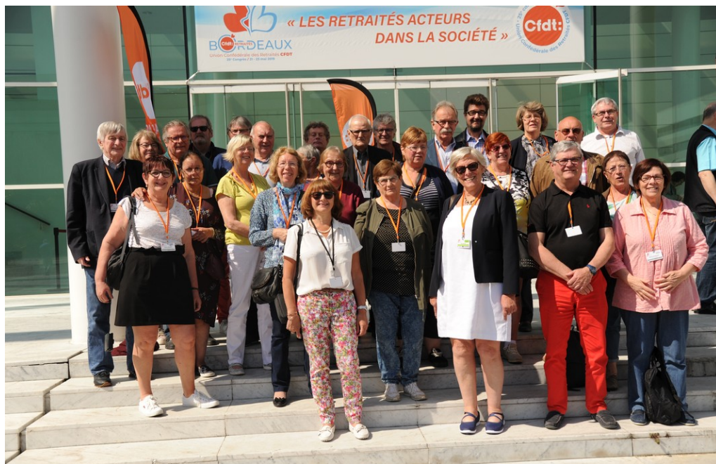
La délégation des Hauts De France avec plusieurs militants de notre UTR.